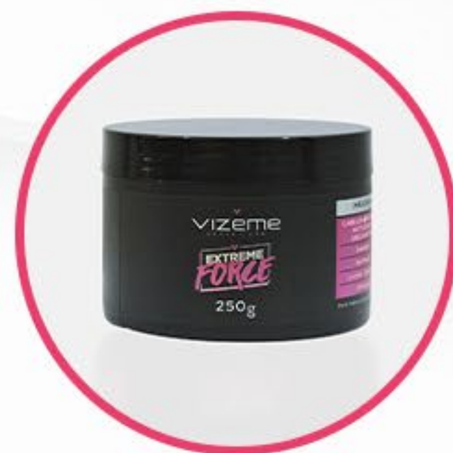
Máscara Extreme Force

Comece sua jornada aplicando o shampoo nos fios molhados, massageando suavemente o couro cabeludo. Enxágue e, se desejar, repita o processo.