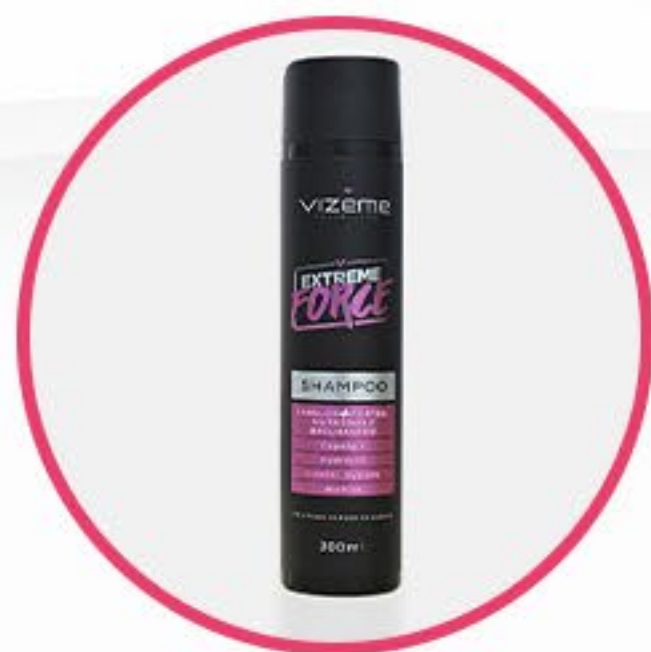
Shampoo Extreme Force

Comece sua jornada aplicando o shampoo nos fios molhados, massageando suavemente o couro cabeludo. Enxágue e, se desejar, repita o processo.