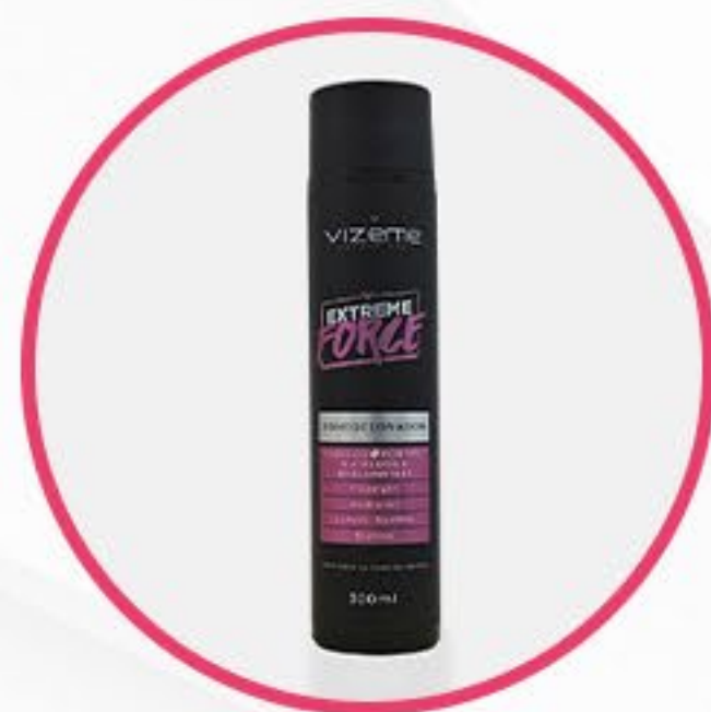
Condicionador Extreme Force

Após retirar o excesso de água, aplique a máscara nos fios, evitando a raiz. Deixe agir por até 5 minutos e enxágue completamente.