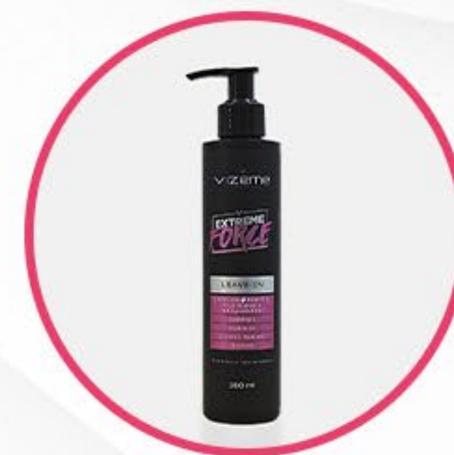
Leave In Extreme Force

Distribua o condicionador uniformemente pelo comprimento e pontas dos cabelos úmidos. Aguarde alguns minutos e enxágue.