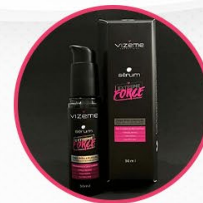
Sérum Extreme Force

Com os cabelos úmidos ou secos, aplique o leave in finalizador. Você pode optar por secar naturalmente ou usar fonte de calor.